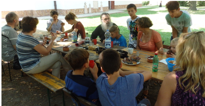
"I Care for Bač" -edizione 2015- Merenda nel monastero ortodosso di Bođani

Quest'estate vuoi vivere una vacanza con un'ottica diversa? Spendendo poco e arricchendoti di nuove conoscenze e amicizie? Scoprendo nuovi sapori, bellezze naturali e beni culturali Patrimonio UNESCO?