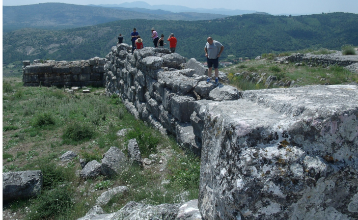
"I Care for Počitelj-Stolac" -edizione 2014- Visita alle rovine dell'antica città di Daorson