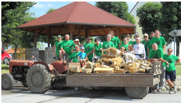
"I Care for Drežnik Grad" -edizione 2012- Fotoricordo dopo pulizia del pozzo medievale

Club UNESCO di Udine Membro della Federazione Italiana dei Club e Centri UNESCO Associata alla Federazione Mondiale