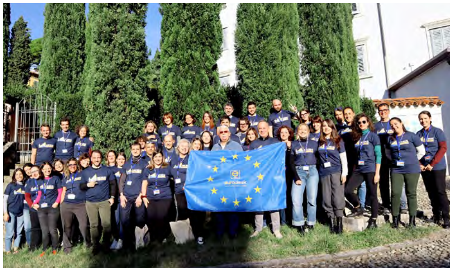
I referenti nazionali di Eurodesk Italy presenti al seminario di Gorizia dal 4 al 7 novembre 2024

supporto del Comune di Gorizia, che ospita il Punto Locale Eurodesk della omonima città. I seminari della rete nazionale italiana Eurodesk si caratterizzano da sempre per fornire la necessaria formazione continua agli operatori e operatrici degli sportelli operanti su tutto il territorio nazionale e, al contempo, per permettere la valutazione dell'impatto del loro lavoro. Sono, inoltre, l'occasione per approfondire tematiche specifiche e per valorizzare la propria rete di contatti all'interno del network. Da sempre, infatti, i seminari annuali hanno rappresentato una grande opportunità per la reciproca conoscenza, il confronto e la pianificazione di attività congiunte con i responsabili delle azioni del programma europeo Erasmus+ e, nel tempo, con i rappresentanti delle Agenzie Nazionali italiane del programma e delle altre strutture nazionali/regionali con le quali Eurodesk collabora. Il Seminario di Formazione ed Aggiornamento ha avuto inizio il pomeriggio di lunedì 4 novembre. Dopo aver presentato i partecipanti e il