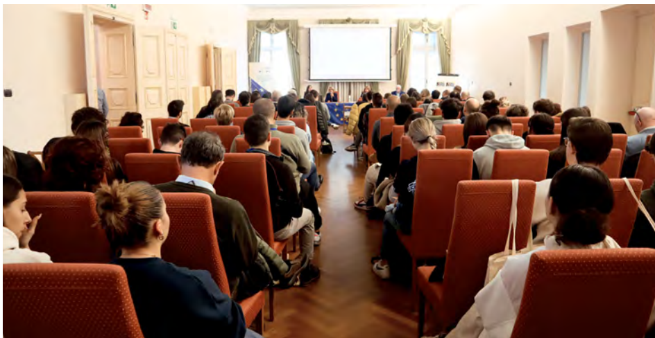
Il pubblico presente a una delle riunioni del seminario

e inclusiva. È stata un'occasione per prendere visione di buone pratiche attraverso progetti di innovazione sociale, progetti ideati e realizzati da giovani che propongono soluzioni innovative a diverse problematiche. È stato previsto inoltre un intervento dell'organizzazione che ha portato la città di Gorizia ad essere proclamata capitale europea della cultura 2025. Nella sessione pomeridiana è stato realizzato un focus sul profilo dell'Eurodesk Mobility Advisor (EMA): il profilo dell'EMA è stato creato, a livello europeo, per dare una denominazione e una certificazione comune ai referenti locali impegnati nelle attività promosse dai Punti Locali Eurodesk; l'erogazione di servizi di alta qualità è da sempre