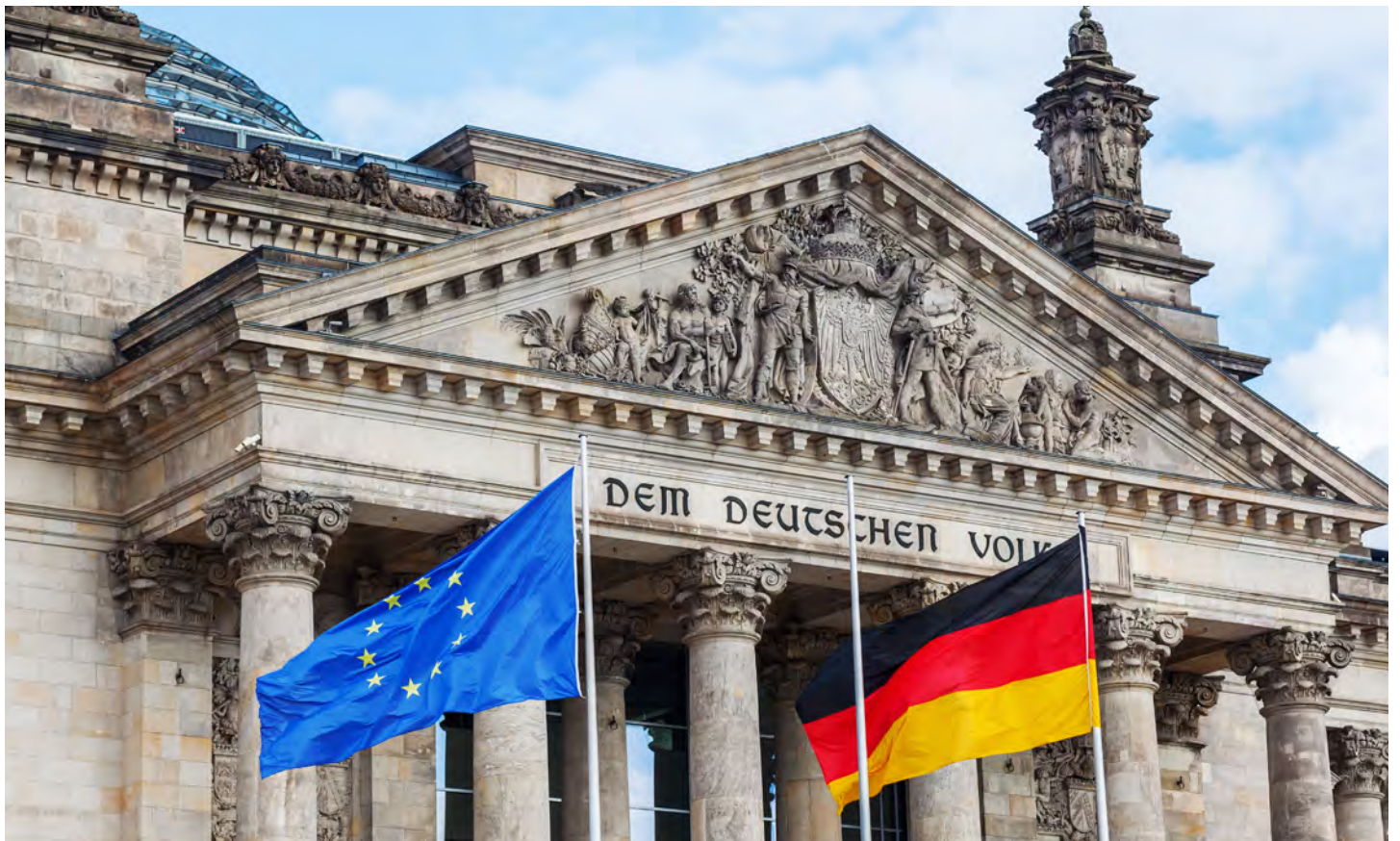
Bundestag, il parlamento tedesco a Berlino.