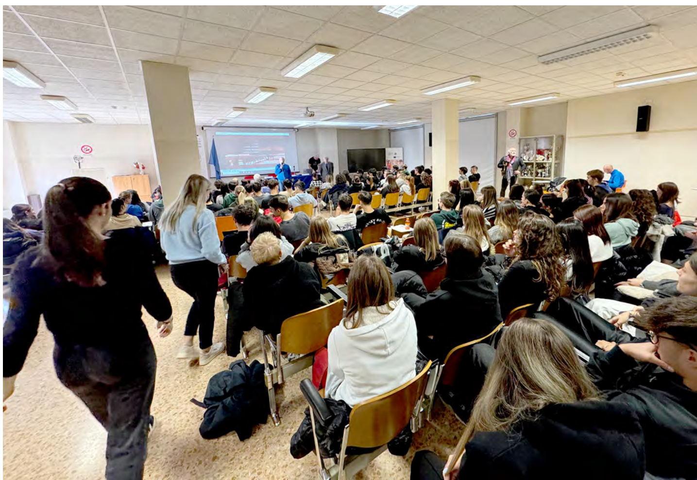
Uno scatto del pubblico presente al convegno

con lo Sbarco in Normandia, rendendo la guerra una questione di spazi e di stagioni meteorologiche e sottolineando i momenti di svolta che decisero le sorti della Seconda guerra mondiale. Viene infine sottolineata la necessità di umanizzare le guerre, facendone una questione di persone – e non solo di macchine e territori –, cosicché si possa conoscere la storia delle guerre anche tramite la testimonianza e la comunicazione delle persone che le vissero.